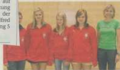
Die Mädchen-Schulmannschaft des Gymnasiums Hartberg sicherte sich bei den Bundesmeisterschaften in Feldkirchen den dritten Rang