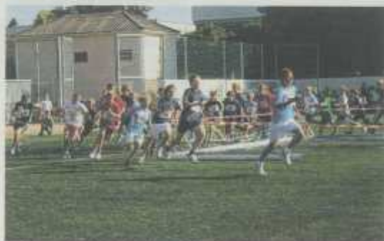
Beim Crosslauf der Hartberger Schulen waren rund 150 Schülerinnen dabei.