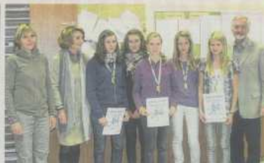
Die schnellen Mädchen vom Gymnasium Hartberg mit den Gratulanten.